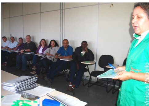
Funcionários da CeasaMinas são incentivados a enviar sugestões para o novo regulamento

A próxima etapa do projeto vai ocorrer nas unidades do interior. Cada uma delas terá seu próprio regulamento de mercado. Os empregados da empresa que trabalham nessas unidades também poderão dar sugestões durante reuniões que ainda não foram agendadas. A CeasaMinas possui unidades em Caratinga, Barbacena, Uberlândia, Juiz de Fora e Governador Valadares.