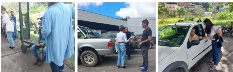
Além da CeasaMinas, participaram da campanha a Secretaria de Assistência Social, Centro de Referência Especializado de Assistência Social (Creas), Centro de Referência da Assistência Social (Cras), Abordagem Social, Rede Cidadã e Secretaria de Educação.

O principal desafio a ser vencido em relação a crianças e adolescentes é a utilização delas para pedir doações. A campanha também orientou sobre temas como exploração sexual infantil e trabalho de crianças e adolescentes.