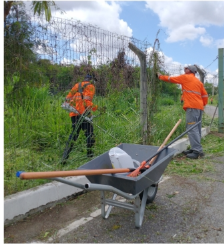
Trabalhadores realizam roçada mecânica e capina manual no entreposto de Contagem