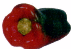
Falta de Pedúnculo