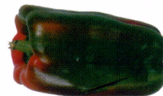
Dano não cicatrizado